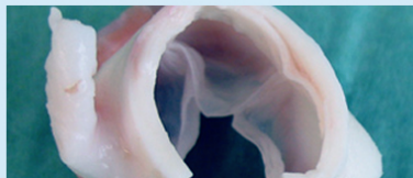
Tissue-engineered valvular grafts